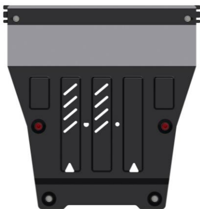
MOTOR & GETRIEBE