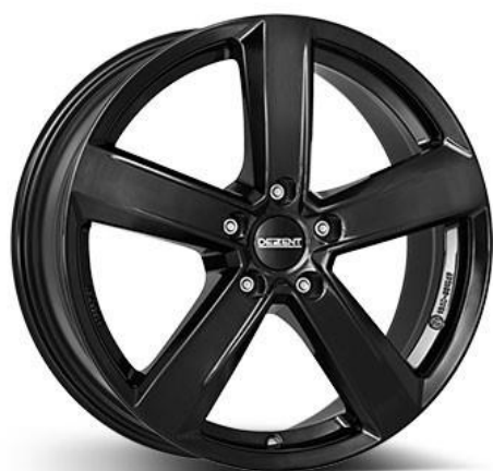
16" ALU-FELGE FÜR VITARA LY INKL. RDKS SENSOREN