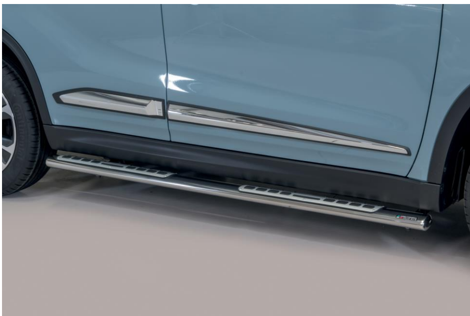
SCHWELLERSCHUTZROHR OVAL 100X60MM DESIGN, MIT TRITTFLÄCHE PAAR, EDELSTAHL