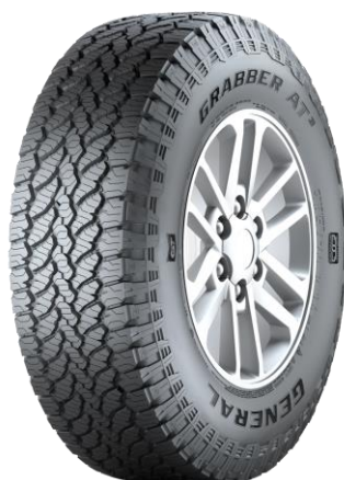
GENERAL GRABBER AT3

FARBE: SILBER ODER SCHWARZ RADGRÖßE: 6,5 X 16 H2 EINPRESSTIEFE: 40MM LOCHKREIS: 114,3 X 5